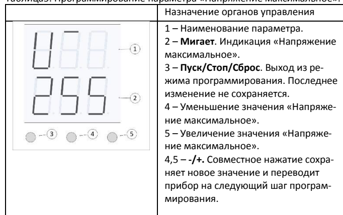
Таблица5. Программирование параметра «Напряжение максимальное».